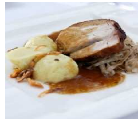
Vepřová pečeně s knedlíkem a se zelím