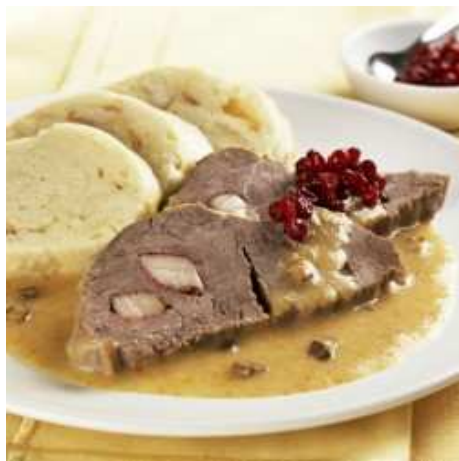
Svíčková na smetaně