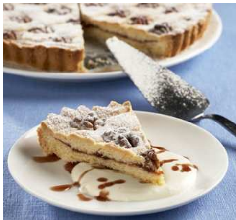
Babiččin mřížkový koláč