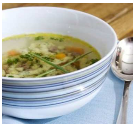
Vývar s petrželovým kapáním