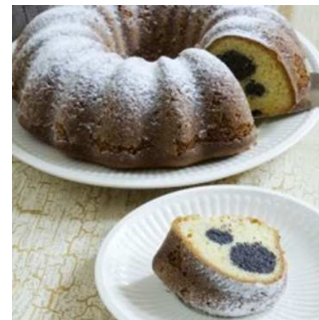
Chalupářská maková bábovka