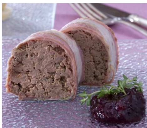
Masová paštika s játry a brusinkami